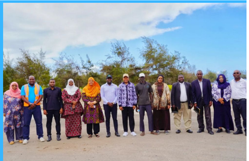
Viongozi wa Afisi ya Rais Kazi Uchumi na Uwekezaji wakiwa katika picha ya pamoja baada ya kumaliza ziara ya ukaguzi wa Mradi wa Ujenzi wa Miundombinu ya Barabara Maeneo huru ya Uwekezaji Micheweni Pemba.