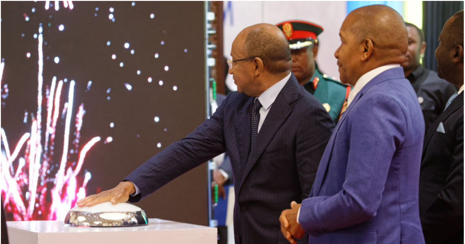
Rais wa Zanzibar na Mwenyekiti wa Baraza la Mapinduzi Dk. Hussein Ali Mwinyi akizindua Muongozo wa Uwekezaji na Mfumo wa Kieletroniki wa Uwekezaji (ZIPA) katika hoteli ya Golden tulip Uwanja wa Ndege Zanzibar.

Mamlaka ya kukuza Uwekezaji Zanzibar (ZIPA) ni Taasisi ya Serikali ambayo ipo chini ya Afisi ya Raisi, Kazi, Uchumi na uwekezaji inayofanya kazi zake kwa mujibu wa Sheria nambari 14 ya mwaka 2014 ambayo imeipa mamlaka Taasisi hiyo kushajiisha uwekezaji wa Ndani na Nje kwa kuzingatia Sera ,Miongozo na Ilani ya Chama cha Mapinduzi na kuishauri Serikali juu ya Mikakati sahihi itakayowezesha kuendeleza biashara na kutoa huduma bora kwa Uwekezaji.