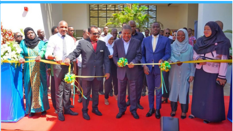
Mheshimiwa Dk. Ali Mohamed Shein Rais wa Zanzibar na Mwenyekiti wa Baraza la Mapinduzi Mstaafu akifungua radi wa Hoteli ya Nyota Tano -TOA Hotel and SPA iliyopo Matemwe Kaskazini Unguja.