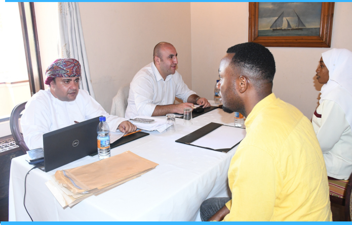
vijana waliojijitokeza katika zoezi la usaili wa nafasi za kazi katika hoteli ya St. Regis Al Mouj iliyopo Nchini Muscut Oman, iliyofanyika katika hoteli ya Serena Shangani Mjini Unguja.