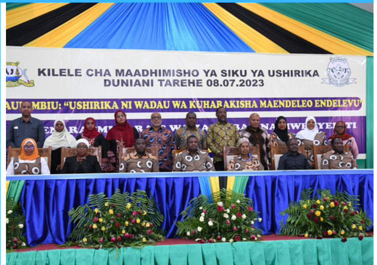
Waziri wa Nchi Afisi ya Rais, Kazi, Uchumi na Uwekezaji akiwa katika picha ya pamoja na Makamo wa Pili wa Rais Mhe. Hemedi Suleiman Abdallah pamoja na viongozi wengine wa Serikali ya Mapinduzi ya Zanzibar katika Maadhimisho ya Siku ya Ushirika Duniani yaliyofanyika katika Ukumbi wa Ziwani Mkoa wa Mjini Magharibi.