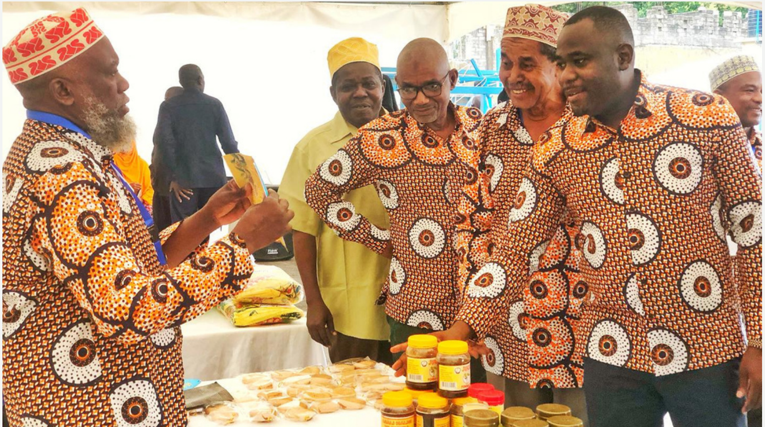
Waziri wa Nchi, Afisi ya Rais, Kazi, Uchumi na Uwekezaji akikagua mabanda la wajasiriamali katika hafla ya Maadhimisho ya Siku ya Ushirika Duniani yaliyofanyika katika Ukumbi wa Ziwani Mkoa wa Mjini Magharib Unguja.

Ujasiriamali ni ajira ambayo inatokana na misingi ya utayari pamoja na maandalizi mazuri ambayo yataiwezesha jamii kuweza kuzifikia fursa zilizopo na kutimiza malengo yake na kujikwamua na umasikini nchini.