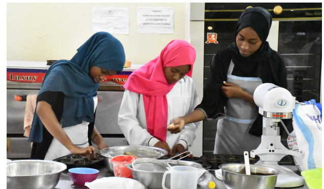
Vijana wakiwa katika mafunzo ya upishi wa vyakula vya aina mbalimbali ikiwemo mikate, vileja na keki katika Chuo cha Kukuza na Kulea Wajasiriamali Zanzibar (ZTBI) kilichopo Mbweni Wilaya ya Mjini Unguja

Itakumbukwa kuwa kila ifikapo Jumamosi wa mwanzo ya mwezi wa Julai ya kila Mwaka ni Maadhimisho ya Siku ya Ushirika Duniani. Kauli mbiu ya mwaka huu ilikuwa ni” USHIRIKA NI WADAU WA KUHARAKISHA MAENDELEO ENDELEVU”