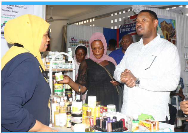
Mkurugenzi Mtendaji wa ZEEA Ndg Juma Burhan Mohamed akizungumza na wajasiriamali wa Zanzibar walioshiriki katika maeneoshu ya 47 ya kimataifa ya saba saba jijini Dar es Salaam.

Pamoja na kufanikiwa kukagua na kutathmini maombi mapya 75 (Unguja 29 na Pemba 46) ya mikopo kupitia programu ya Inuka yenye thamani ya TZS 2,781,915,600. (Pemba TZS 799,932,000 na Unguja TZS 1,981,983,600). Kati ya maombi hayo, maombi 14 ni ya wawekezaji wa ndani (local investors) yenye thamani ya TZS 271,000,000.